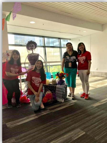
◎與志工活動的主管合照

透過同行同學的主管介紹，我們有機會能在曼尼托巴省每年最盛大的多國文化活動—Folklorama中，擔任墨西哥展覽館的志工。我的主要工作為財務部的收銀員(cashier)，工作就是在食物部門後點算客人購買的食物，然後收取現金或刷卡的服務。因為是在墨西哥館中工作，主要工作人員及菜單所使用的語言都是西班牙文，對於西班牙文一竅不通的我等於是來到了另外一個世界。第一天工作就要把所有西班牙文菜單的品項背起來，並且對應上實際的商品。工作中做大的壓力來源就是，看到客人餐盤上的食物及飲料之後，要馬上在ipad上計算價錢並告知客人，操作刷